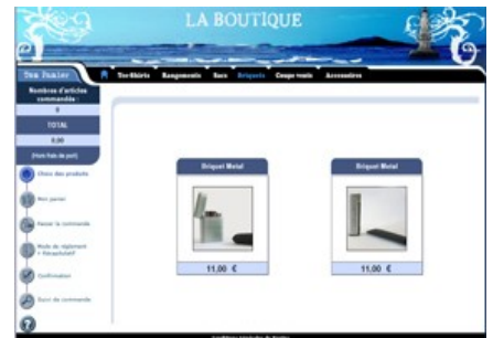
Menu d'administration de la Boutique

Grâce à votre site marchand, les internautes auront la possibilité de consulter votre catalogue, de sélectionner des produits, de les commander et de les payer en ligne. Une fois le paiement effectué, les commandes vous seront envoyées par e-mail ou accessibles par l'intermédiaire d'une interface de gestion. Nous vous proposons des modules d'administration simple qui vous permettront de faire évoluer votre site rapidement et sans intervention technique, comme et quand vous le voulez.